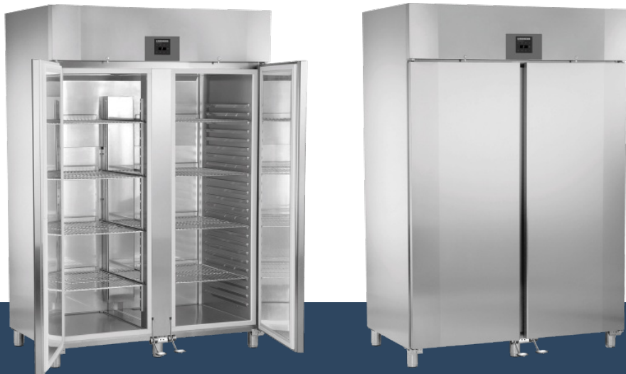
GKPv 1490 ProfiPremiumline